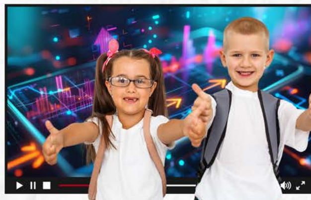
אומנות ועיצוב דיגיטלי