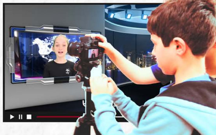
תקשורת, יצירת תוכן ועריכת וידאו

צרו קשר עוד היום. לפרטים ותיאום פגישה: אלין 053-8255257, משרד 053-8008007 ארכיטקט.קום