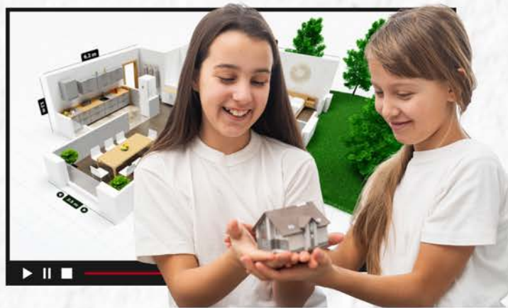
עיצוב בתלת מימד