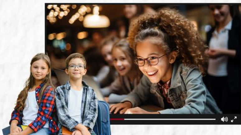
אתגרי חשיבה וחדרי בריחה